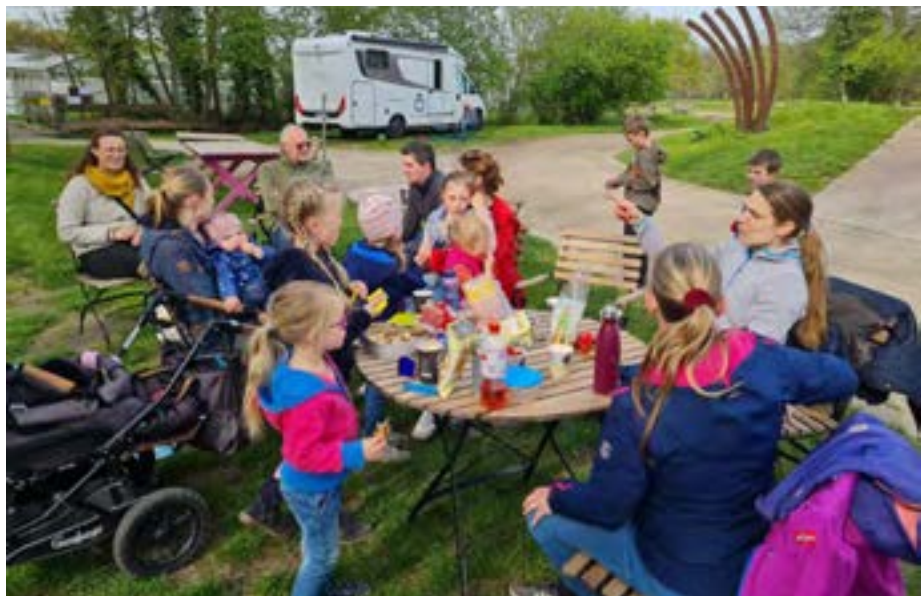
Ausflug der Kirchenmäuse zum Schultenhof in Dortmund