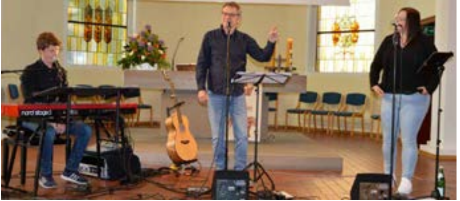
Eröffnungskonzert mit dem Trio HERZ+MUND