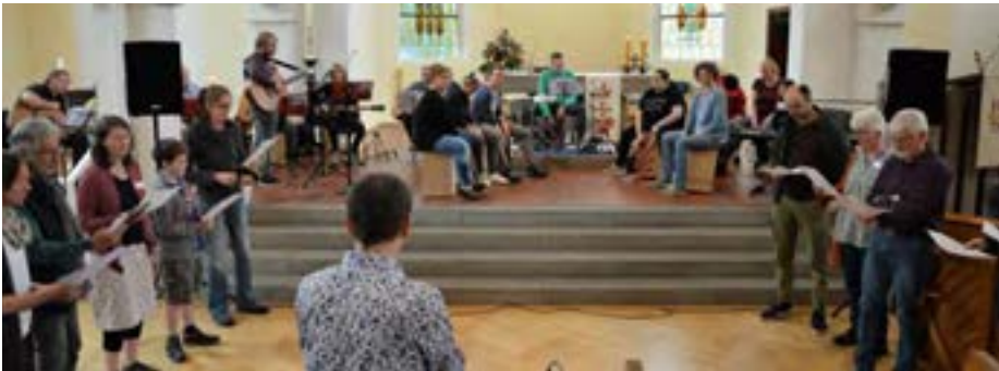
Voller Einsatz im Werkstattkonzert am Samstag