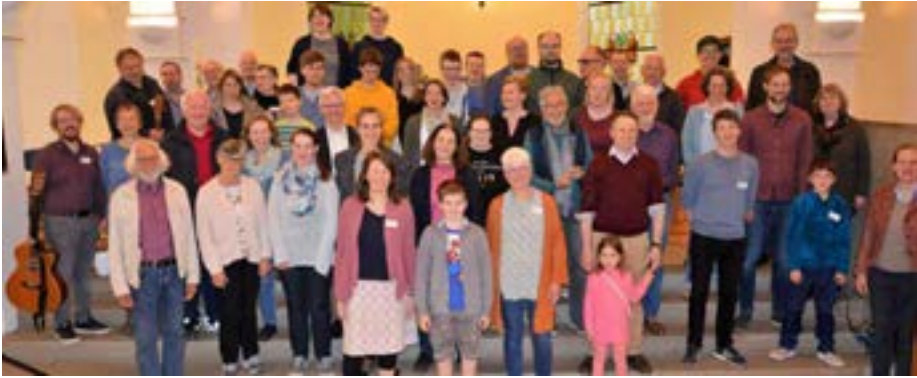
Alle Teilnehmerinnen und Teilnehmer der AKT