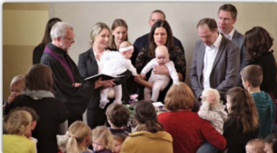
Familiengottesdienst am 1. Advent mit zwei Taufen und Anspiel der Konfirmanden