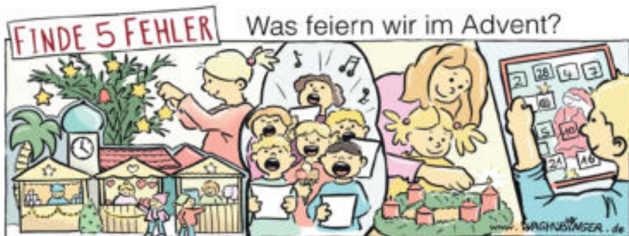
Palme, Tulpe, Eis, Sie Kerze, Türchen Nr. 28